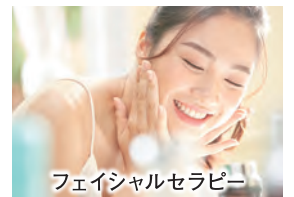
フェイシャルセラピー